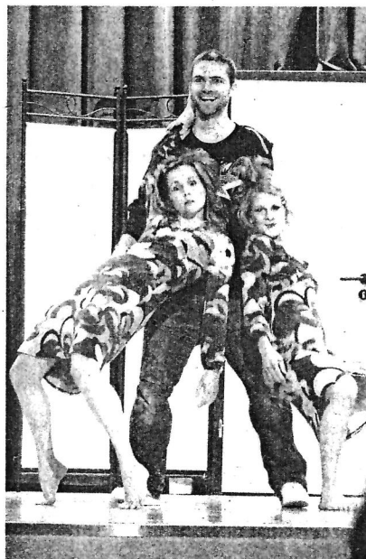
Eine Tanz-Szene aus dem Programm von momentum dance.

Zur Belohnung konnten die Jugendlichen aus den ersten beiden Sekundar-