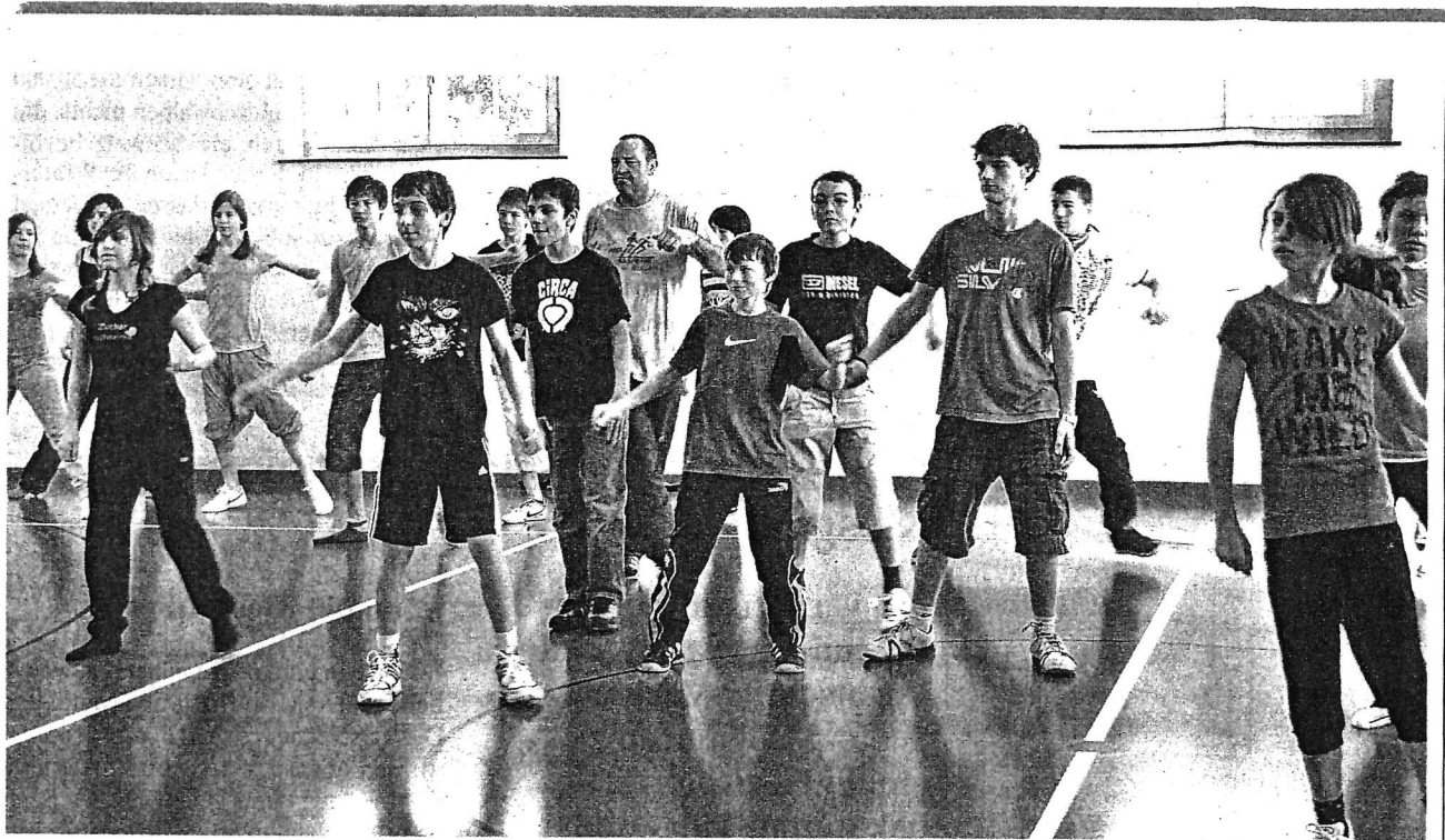
In der Turnhalle wurde unter kundiger Anleitung konzentriert Hip Hop geübt.